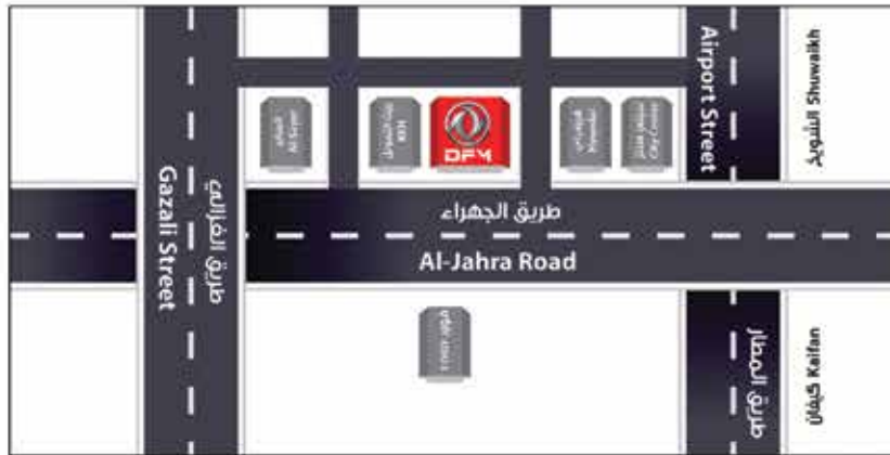
معرض التلال (الشويخ) Tilal Showroom (Shwaikh): 22256700