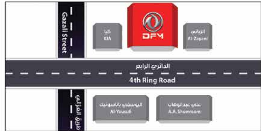
معرض (الري) Showroom (Al Rai): 1833334