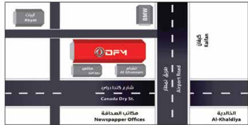
مركز خدمة (الشويخ) Service Center (Shwaikh): 24838470/1/2/3 - 24838286 - 24814611 مركز قطع الغيار Spare Parts Center 24838470/1/2/3 مركز الصبغ والحدادة Body Repair & Paint Center: 24838470/1/2/3