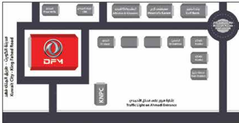
معرض ومركز خدمة (الأحمدي) Showroom & Service Center (Al Ahmadi): 23981435/8/9